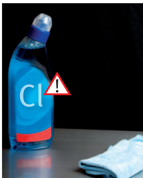
Los productos que contienen cloruros deben aplicarse con cuidado, incluso si se indican para el acero inoxidable. El exceso de concentración, un tiempo de contacto prolongado y el aclarado incompleto pueden generar la aparición de corrosión. Las instrucciones deben seguirse cuidadosamente.

La sal o los limpiadores que contengan cloruros pueden producir daños. Echar un vistazo a la composición: si aparece el símbolo “Cl”, existe posibilidad de que el producto dañe metales como el acero inoxidable. Los polvos de limpieza duros pueden provocar arañazos.