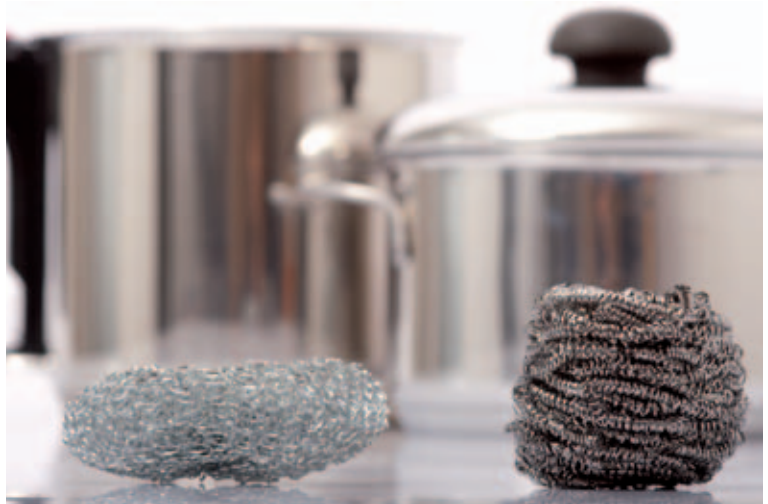
Utiliza sólo estropajos de acero inoxidable o nylon para limpiar sartenes y ollas de acero inoxidable, nunca de acero común.

Los restos de comida quemada pueden limpiarse llenando el cazo de agua caliente y disolviendo en él unas cucharaditas de sosa o carbonato sódico ( \text{Na}_2\text{CO}_3 , disponible en supermercados), dejando que la disolución actúe unas horas, ayudando de esta manera a reblandecer los depósitos más persistentes. El carbonato de sodio no es tóxico y es inofensivo con el medio ambiente.