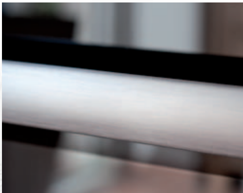
Las superficies decorativas siempre deben de ser limpiadas en la dirección del pulido, no perpendicular a él.

las superficies del acero inoxidable resultan un problema en los nuevos electrodomésticos. Después de sólo unas pocas semanas de uso, las manchas de dedos son menos apreciables que cuando la superficie era nueva. También existen superficies anti-huellas que reducen notablemente la visibilidad de las huellas.