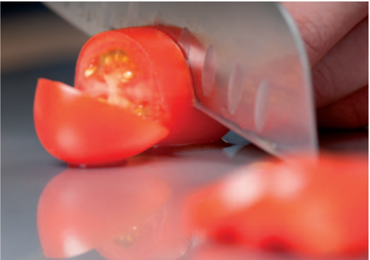
El acero inoxidable es resistente a los ácidos de jugos de frutas y verduras.

La excelente resistencia a la corrosión de los aceros inoxidables utilizados en cocinas implica que resistan el ataque y las manchas de alimentos como tomates, pimientos rojos o zumos de fruta que podrían afectar las superficies de otros materiales.