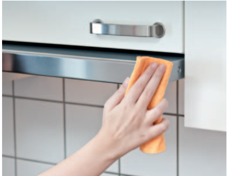
Un paño de microfibra ligeramente húmedo limpiará correctamente las marcas de dedos de los acabados decorativos.

En los acabados de acero inoxidable tipo espejo, los limpiadores de cristal tienen un buen funcionamiento. Hay que evitar productos abrasivos, ya que pueden producir arañazos. En satinados y pulidos, limpiar siempre en la dirección del pulido y no perpendicular a él. Las huellas de dedos en